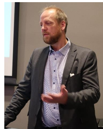
Bilde 2 Leder av NFF, Øyvind Engelstad, forteller om ståa i foreningen på frokostmøtet på SAS-hotellet