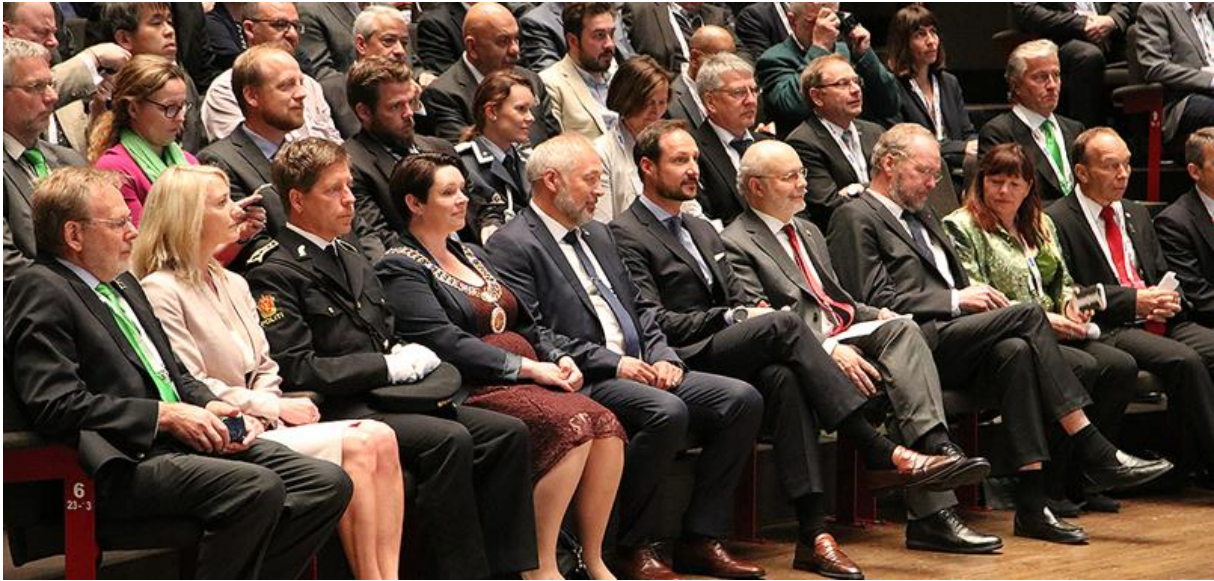
Bilde 3 Stor stas at H.M. Kronprins Haakon var tilstede ved åpningen av WTC i Bergen