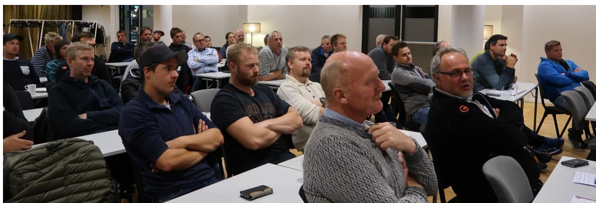
Bilde 6 Engasjerte bergsprengere på temakveld i Stavanger