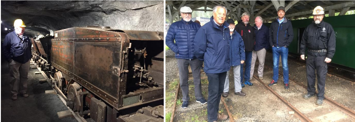
Bilde 10 Kulturutvalget på besøk i sølvgruvene på Kongsberg