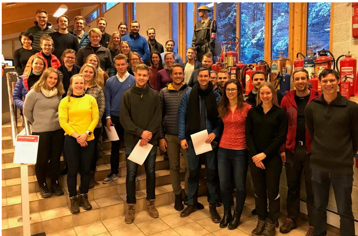
Bilde 11 Blide deltakere på Yngres nettverk sin fagdag om brannsikkerhet i tunnel