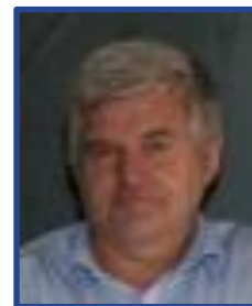
Roar Sve Skanska