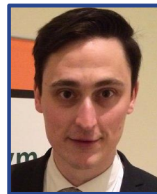
Sindre Log The Robbins Company